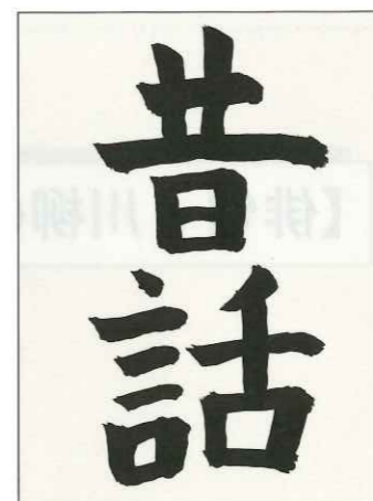
土佐町小 4年生 石川 吾朗