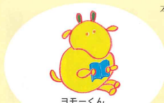
ヨモークン 国語力向上イメージキャラクター 土佐町

合わせて380作品と、多数の力作を寄せていただきました。その中からそれぞれの部で最優秀賞、優秀賞、各1点、入選数点を選考し作品集にまとめました。