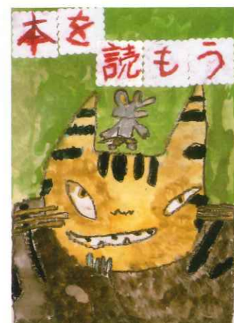
土佐町小 2年生 杉本 旬