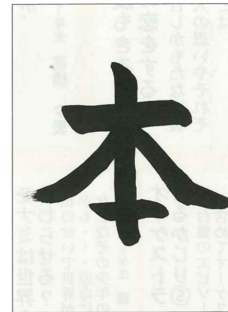
土佐町小 3年生 山中 楓里