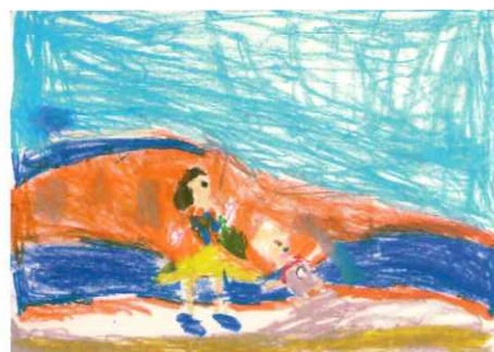
みつば保育園 池沢 らん