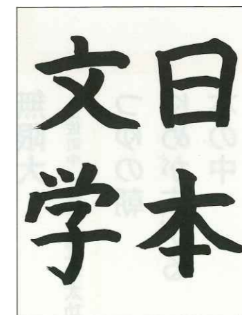
土佐町小 5年生 川井 花音