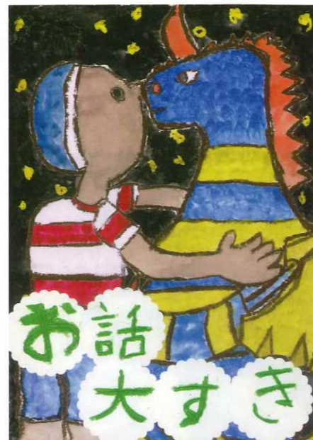
土佐町小 2年生 池沢 花