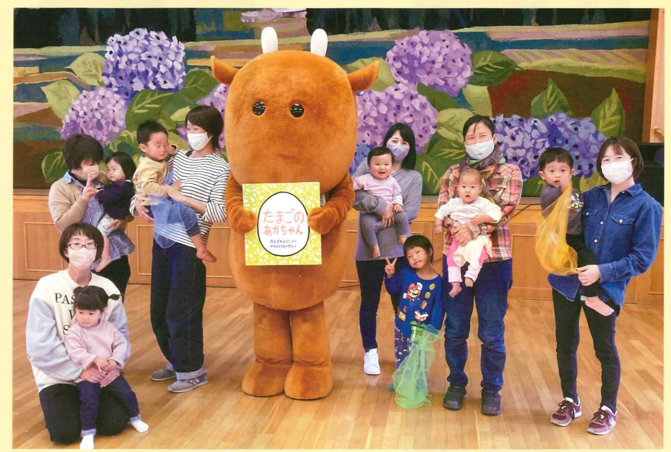
ヨモークン～本読んで

「読書」を基盤とした国語力向上の取組の一環として始まった土佐町読書推進作品展も第19回を迎えました。