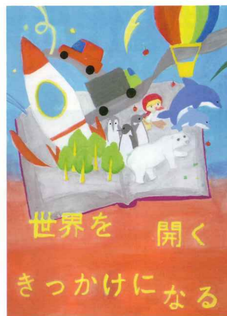
土佐町中 1年生 山中 藍梨