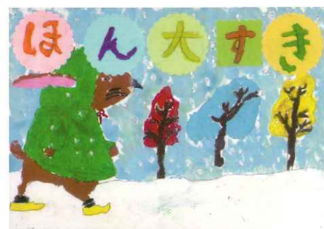
土佐町小 1年生 谷 こなつ