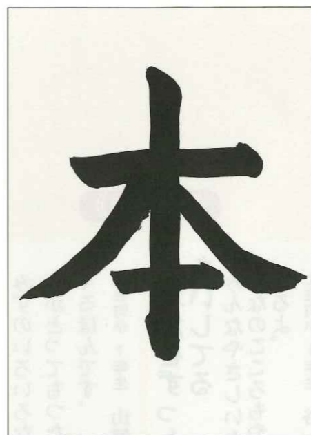
土佐町小 3年生 三瓶 素生