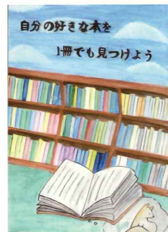
土佐町中 1年生 橋田 花撫