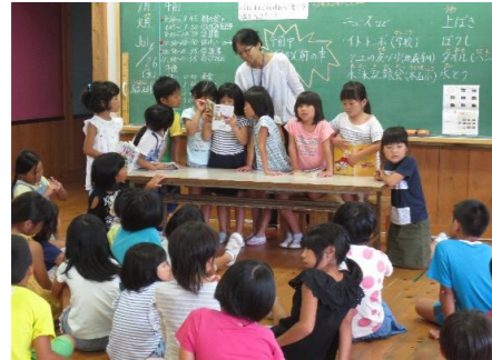
ハートタイム 1年生