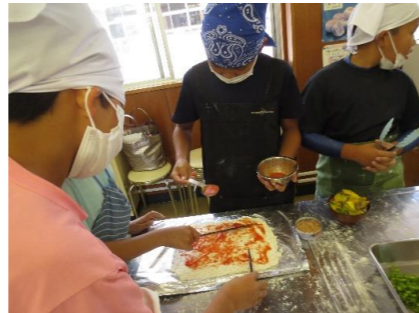
ピザ作り体験教室