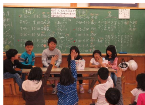
ハートタイムの様子