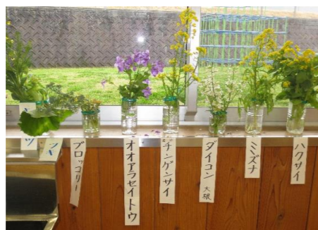
春の草花の勉強をしました