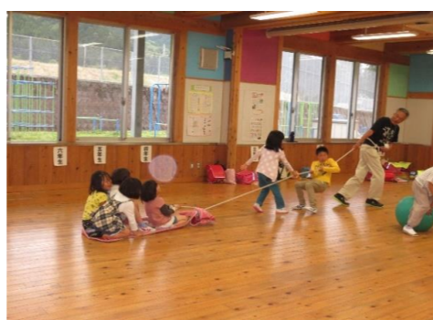
力を合わせてうんとこしょ!