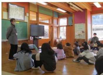
七草がゆのはなし