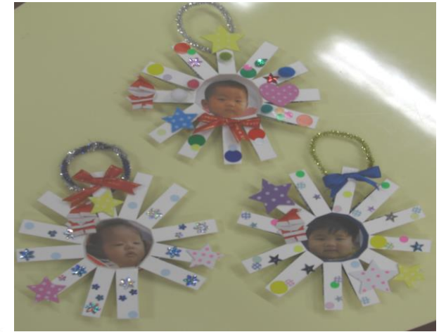
【12月は、リースを作りました】