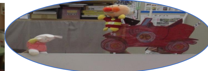
5月のお話会の様子