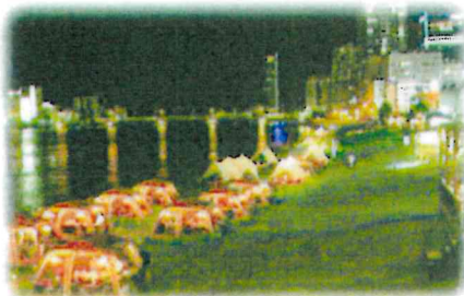
民間事業者の参加 (信濃川/新潟市)