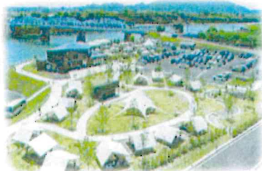
賑わい拠点の整備 (木曾川/美濃加茂市)