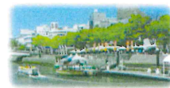
親水護岸の利用 (新町川/徳島市)