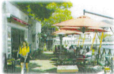
オープンカフェの設置 (京橋川/広島市)