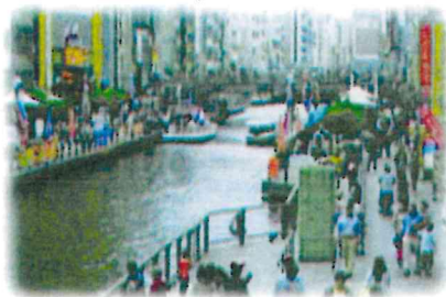
遊歩道の民間活用 (道頓堀川/大阪市)