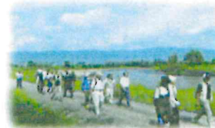
河川管理用通路の利用 (最上川/長井市)