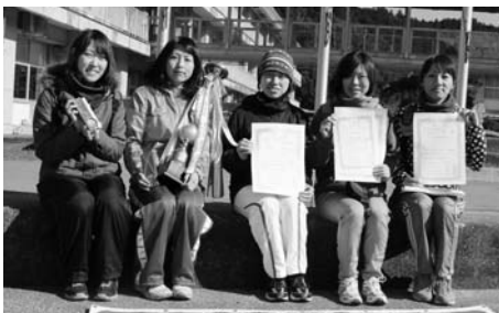
土佐町役場Bチーム