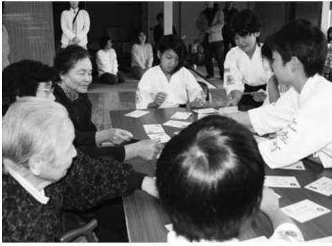
松ヶ丘地域の老人クラブとの交流会

土佐町少年剣道では、毎年地区の少年寄りとの交流をしています。今年も松ヶ丘地区の老人クラブと交流をしました。剣道のけい古や試合、木刀の形などを見てもらい、その後ゲームも楽