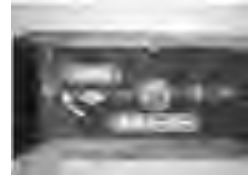
写真はハンドル式

もし凍結して管などが破損した場合は、 すぐに水道メーター横にある止水栓（レバーかハンドル式）を閉めると水が止まります。 それから水道業者に連絡して下さい。