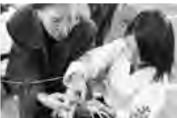
相川老人クラブとの交流(縄ない)

土佐町少年剣道は、毎年社会福祉協議会のお世話で各地区を回り老人クラブの皆さんと交流をしています。今年11月10日に相川老人クラブのみなさんと交流をしました。交流では、少年剣道の練習、試合、木刀の形などを披露し、ゲームや、縄ないを一緒にして楽しく交流をしました。そのあとみんなであとみんなで昼食を取り、楽しいひと時を過ごしました。