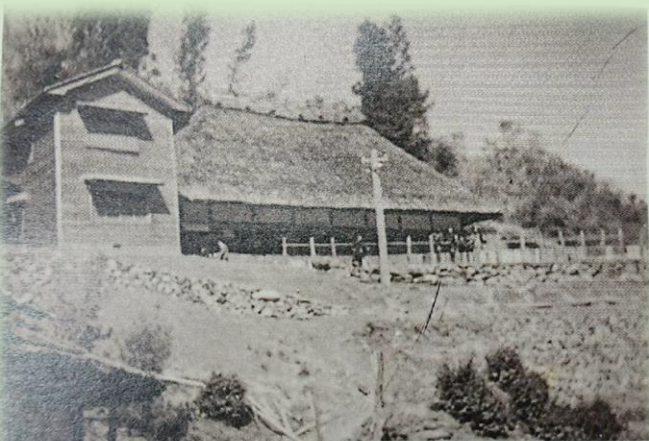
かやぶき校舎 29年頃まで