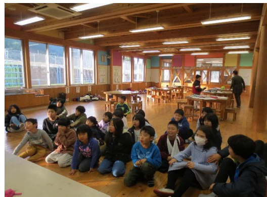
朝の集合時間 昨日の出来事 きょうは何の日？

平成31年 1月31日 発行 土佐町学校応援団推進本部 土佐町教育委員会 No.117号