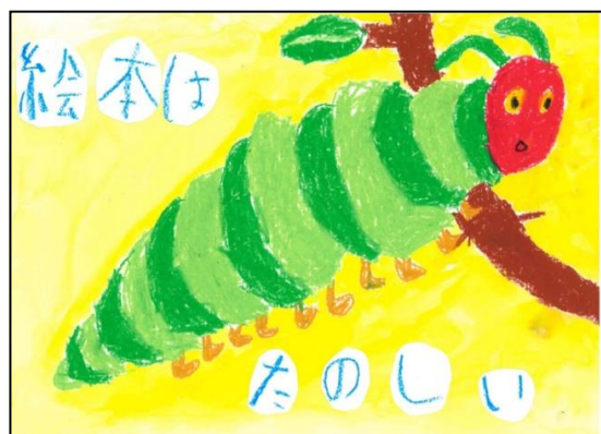
第17回ホスターの部最優秀 土佐町小2年 筒井 遥香