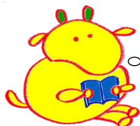
ヨモークン 土佐町国語力向上 イメージキャラクター