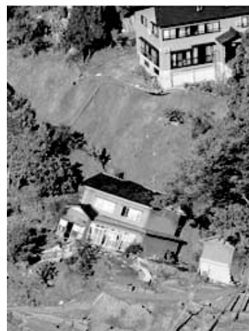
新潟県中越地震で崩れ落ちた民家 (2004年10月24日新潟県山古志村)