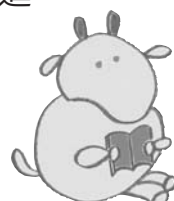
ヨモーくん 土佐町国語力向上 イメージキャラクター