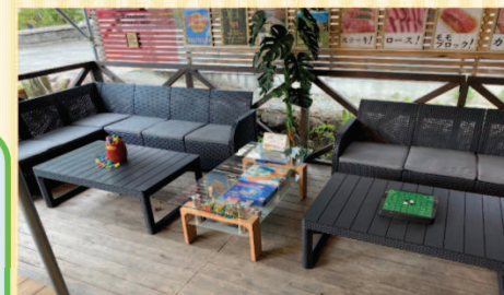
BBQご利用のお客様専用休憩スペース お子様の遊び場としてもご利用ください ゲーム、おもちゃも自由どうぞ。

飲食物の持ち込みOK！ 到着後すぐにBBQスタート！ 片付け不要！ 持ち込みのゴミも処分します。