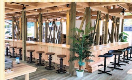
お一人様も歓迎 カウンター席あります。