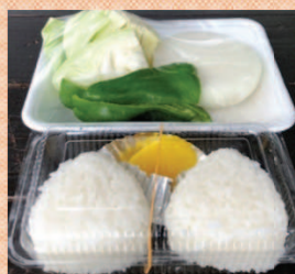
地元の美味しいお米のおにぎり