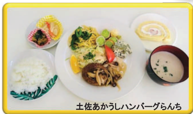
土佐あかうしハンバーグランチ