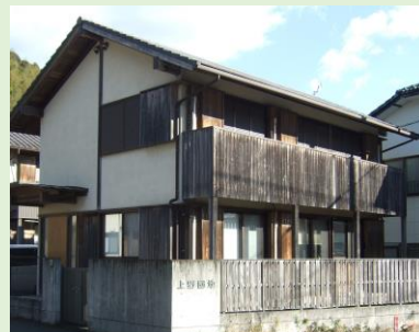
上野町営住宅（モデルハウス）